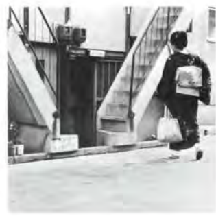
雇仲居 紹介 みつわ会