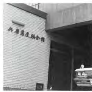
宿泊貸室 兵庫県 遺族会館