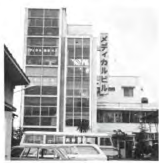
貸ガレージ メデイカル 興産