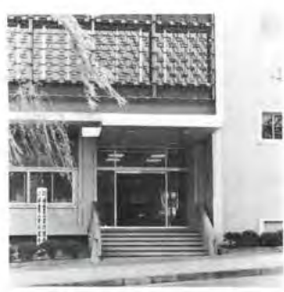
健康保険 川重保険会館