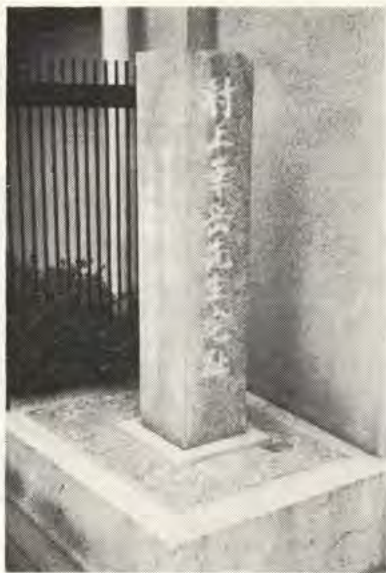
△前兵庫県知事金井元彦氏の筆になる記念碑

三十代で描いた「裸婦」「日高川」、関東震災の際惜しくも焼失してしまつた「聖者の死」等が有名であつたが、身