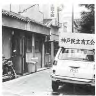
相談 神戸民主商工会