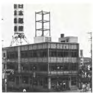
住宅 日本電建神戸支店