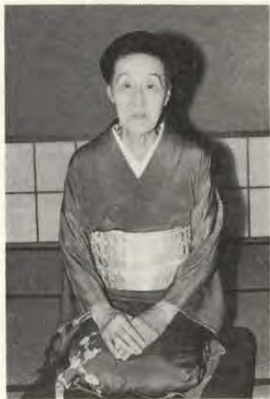
お元気な長駒姐さん

花柳界の斜陽化(?)と共に若い人で新しく芸妓さんになろうという人が少なくなり、芸妓さんの年齢が高令化している折柄、これまた芳紀(?)まさに八十六才という全国一の超々老妓がこの花隈で今も元気で左褌をとっておられる。