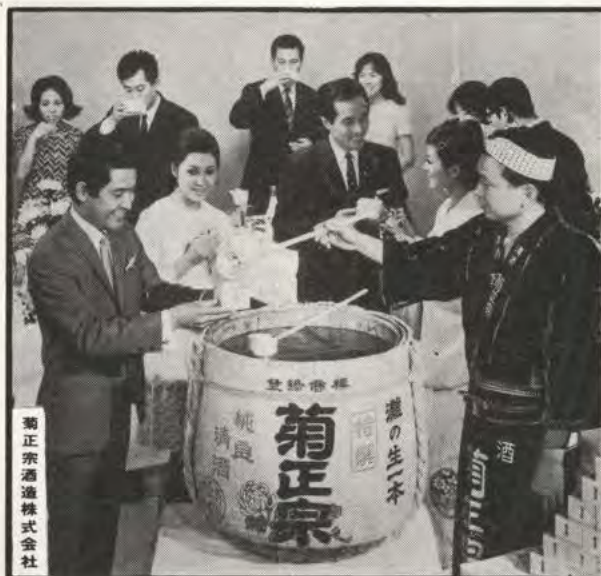
菊正宗酒造株式会社