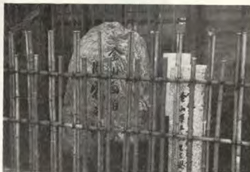
左は「金山画伯旧宅の地」の記念碑と右はお元気な頃の金山平三画伯